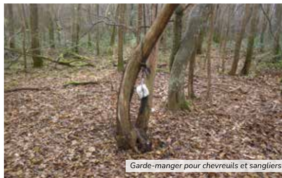
Garde-manger pour chevreuils et sangliers

Aujourd'hui, comme dans beaucoup de lieux de chasse, la priorité est donnée au grand gibier (sangliers, cerfs, biches, chevreuils, etc ...). A FRESNES, nous avons un beau cheptel de chevreuils et quelques sangliers surtout de passage. La saison dernière, nous avons prélevé nos sept chevreuils autorisés en battues et deux sangliers. Pour la présente