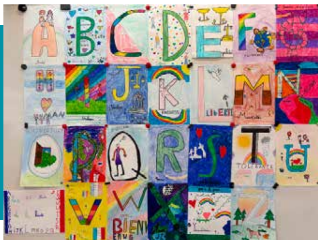
Production CM1/CM2 "L'Abécédaire de La Laïcité"

Les élèves de CM1/CM2 ont participé à un concours sur la laïcité organisé par l'Education Nationale et la Ligue de l'Enseignement. Nous sommes très heureuses d'annoncer qu'ils ont été lauréats.