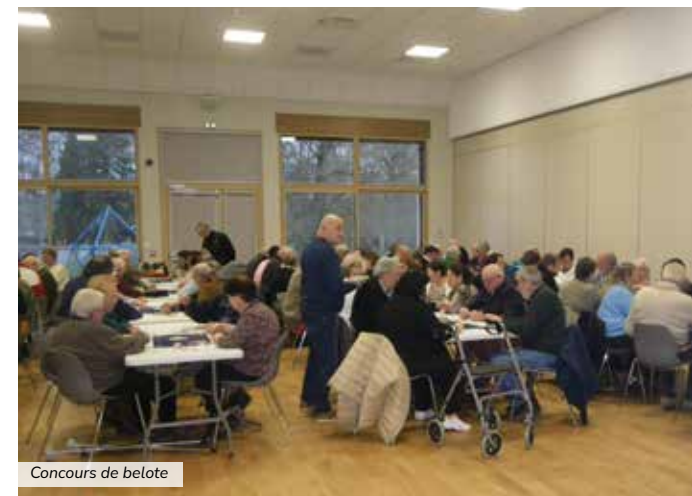
Concours de belote