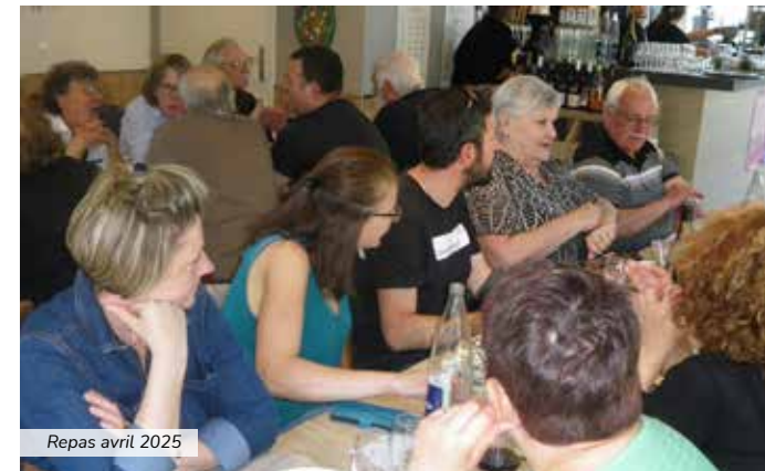
Repas avril 2025

Nous remercions particulièrement les propriétaires et riverains non chasseurs qui nous permettent de pratiquer notre passion au plus près de DAME NATURE. Pour tout renseignement ou signalement merci de contacter le bureau via la Mairie.