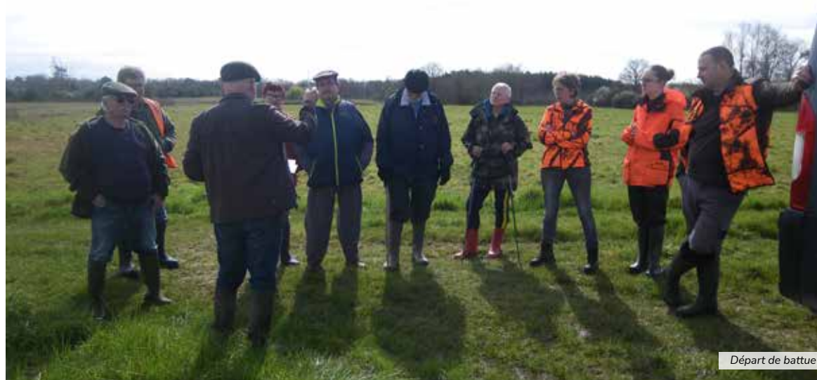
Départ de battue