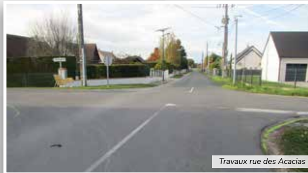
Travaux rue des Acacias