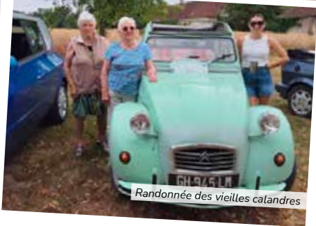
Randonnée des vieilles calandres