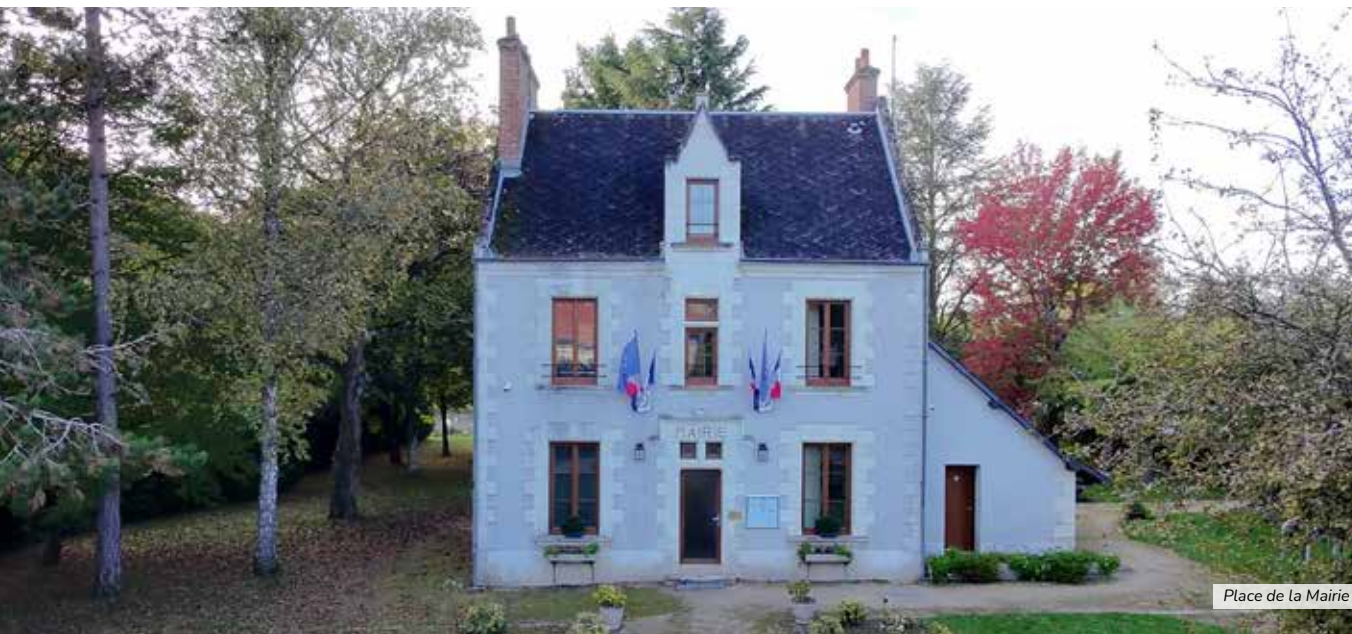
Place de la Mairie